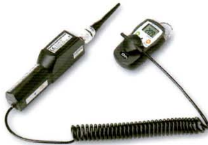
▲ 사용 예1