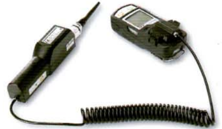
▲ 사용 예2