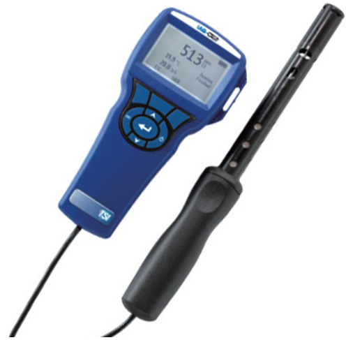
Model : 7545 / 7575